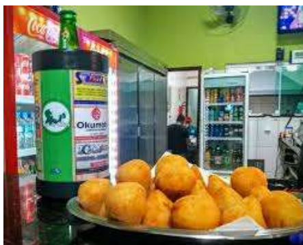
Coxinha (Bar do chico)